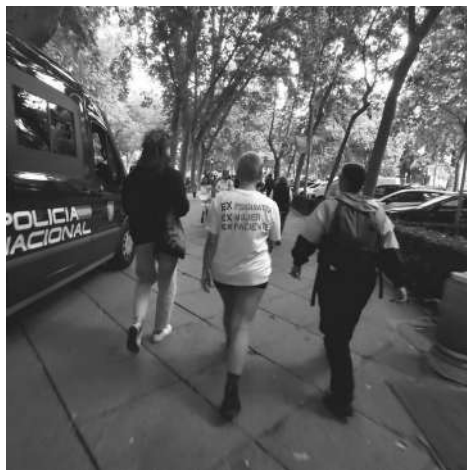
Manifestación del Orgullo Loco en Madrid, 3 de junio de 2023

bloquear el uso obligado de drogas psiquiátricas 1 . Hasta el 19 de septiembre no se decide que sí, que lo cerramos. No sucede hasta el 1 de noviembre. Por el medio, en mayo, el Orgullo Loco ya nos resulta inaguantable, algunos vamos a despedirnos, con polémica, para variar.