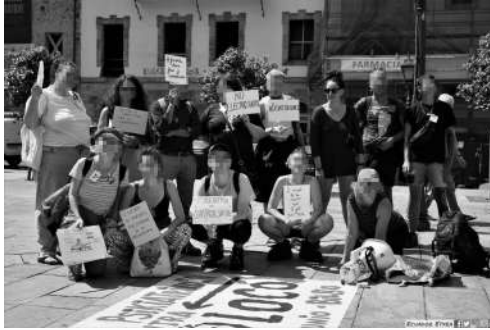
Manifestación del Orgullo Loco en Bilbao, 3 de junio de 2023

Todo ocurre después de una crisis, durante una crisis, para salir de esta, asomando otra. No sabemos cuándo empezamos a llamarle desertar, pero es eso.